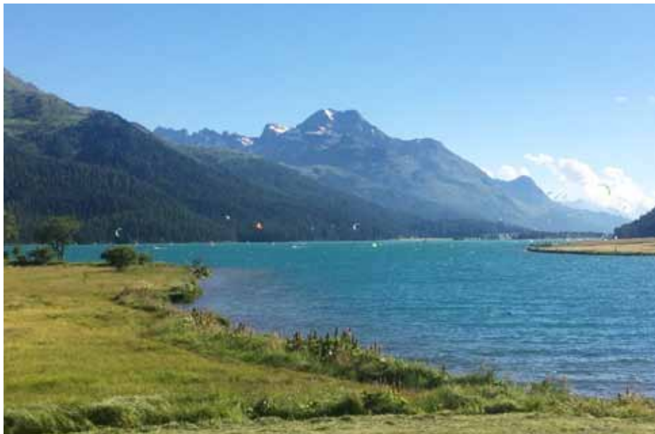
Lej da Silvaplana